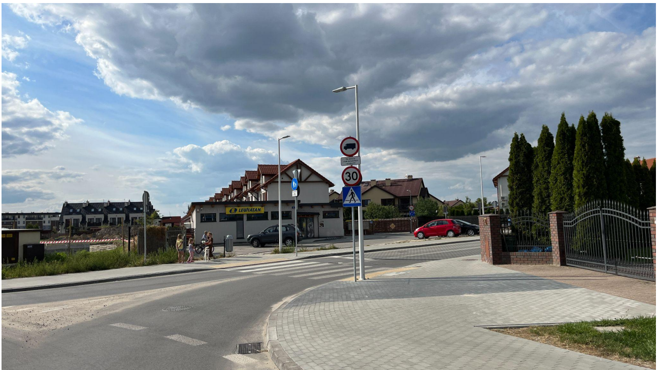
Wjazd na ul. Kukułki