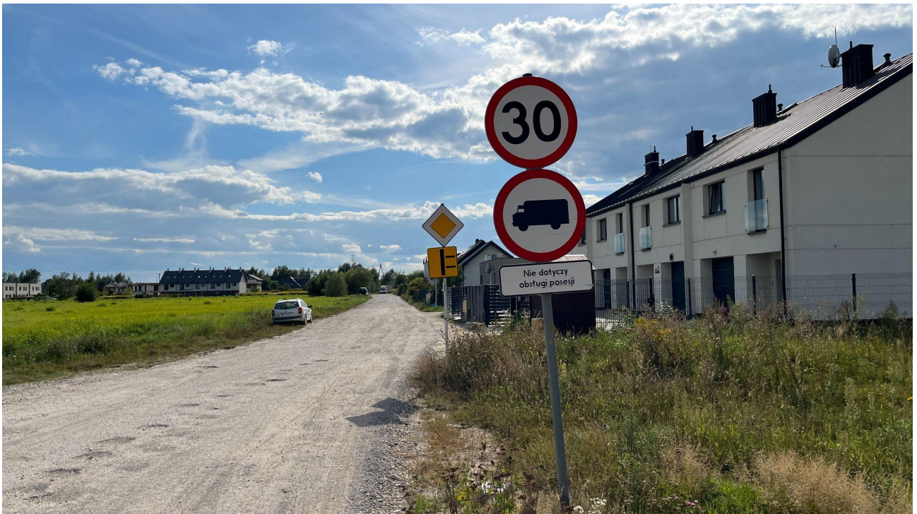
Wjazd na ul Kormoranów

Czerwonym kolorem zaznaczone są ulice po których nie może odbywać się ruch samochodów ciężarowych (znak B-5). Znaki są ustawione na niebieskich punktach ww mapy a oto ich aktualne zdjęcia ( robione 4 września 2022)