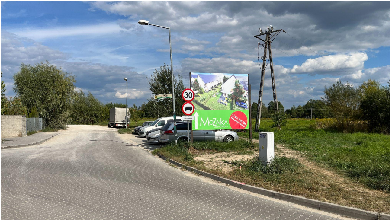
Skrzyżowanie ul Kukułki, Wilgi i Kormoranów